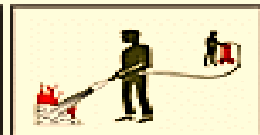
Розпочати гасіння пожежі.