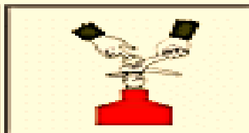
Зірвати пломбу, висмикнути чеку.