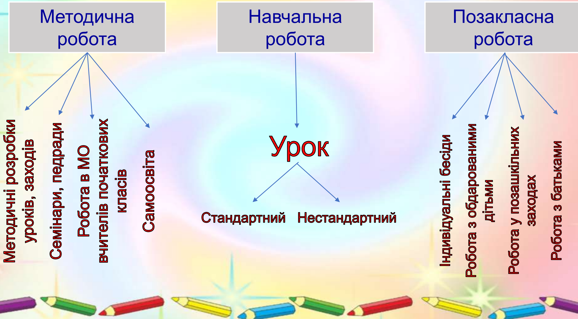
Схема моєї професійної діяльності